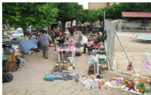
Vide grenier / Foire artisanale